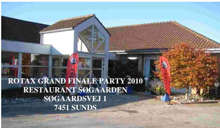
ROTAX GRAND FINALE PARTY 2010 RESTAURANT SØGAARDEN SØGAARDSVEJ 1 7451 SUNDS

ROTAX GRANDE PARTY 2010 - LØRDAG DEN 6. NOVEMBER