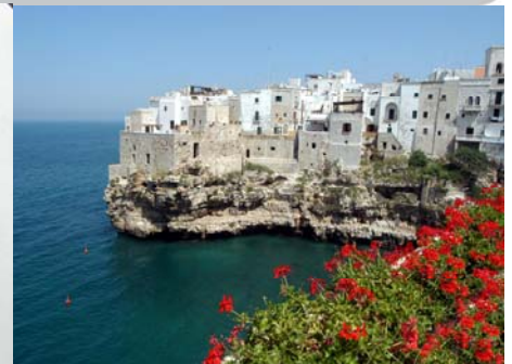
GRAND FINALS 2010 / LA CONCA / ITALY TEAM OF CHASSIS MANUFACTURERS